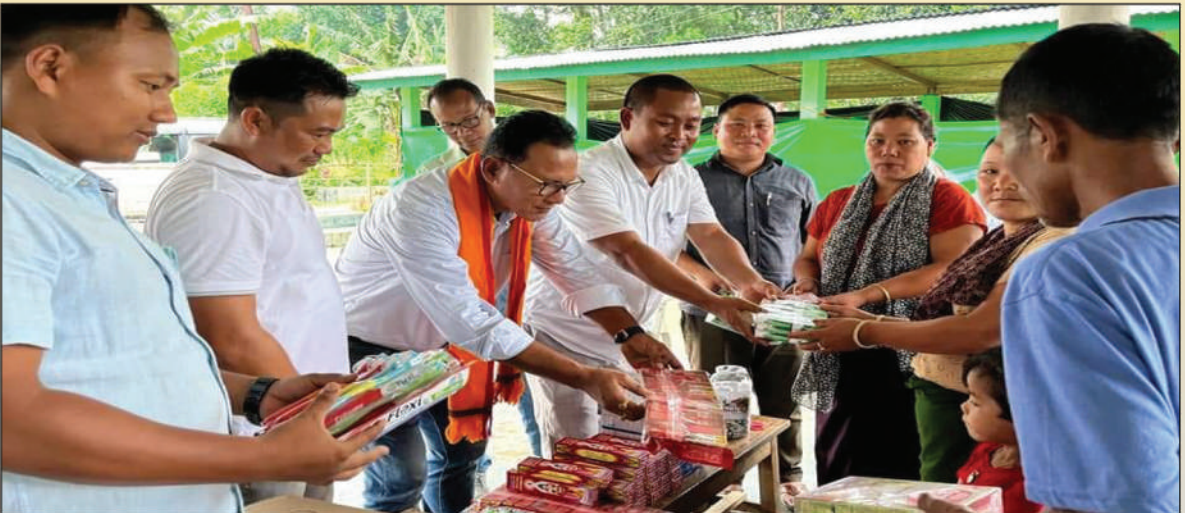
एबसु आरो ट्राइबेल संध जथायै गोब्राब अखा हानायनि जाउनाव दिमा हासावनि हाफलं आरो मायबंआव मिथिंगाया गोबां खहा खालामजानाय सुबुंफोरखौ नायगिदिं हैनायजों लोगोसे हानायखिनि अनसुंथाइ हैनाय थाविन:- हाफलं, दिमा हासाव, कार्बि आंलं, अक्ट':- 27 मे, 2022