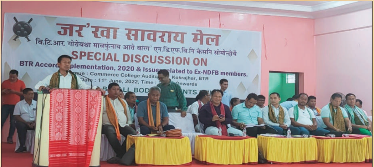
बि.टि.आर. गोरोबथा आरो बारग' एन.डि.एफ.बि.नि केसनि सोमोन्दोयै जर'खा सावराय मेल खुंफुनाय थावनि:- कमाच कलेजनि नब्लां, अक्ट':- 11 जुन, 2022