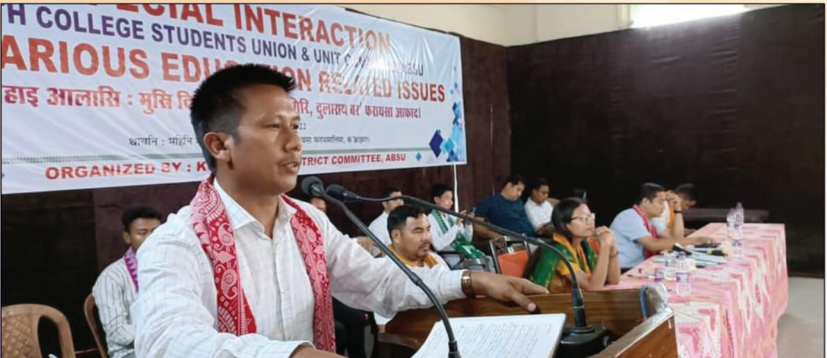
क'क्राझार जिल्ला सिनि गुबुन-गबुन फरायसालिमानि फरायसाफोरजों जर'खा सावराय मेलाव बाहागो लानाय थावनि : महिनि महन ब्रह्म गोसोखां नब्लां, हिन्जावसा फरायसालिमा, क'क्राझार, अक्ट' : 4 जुन, 2022