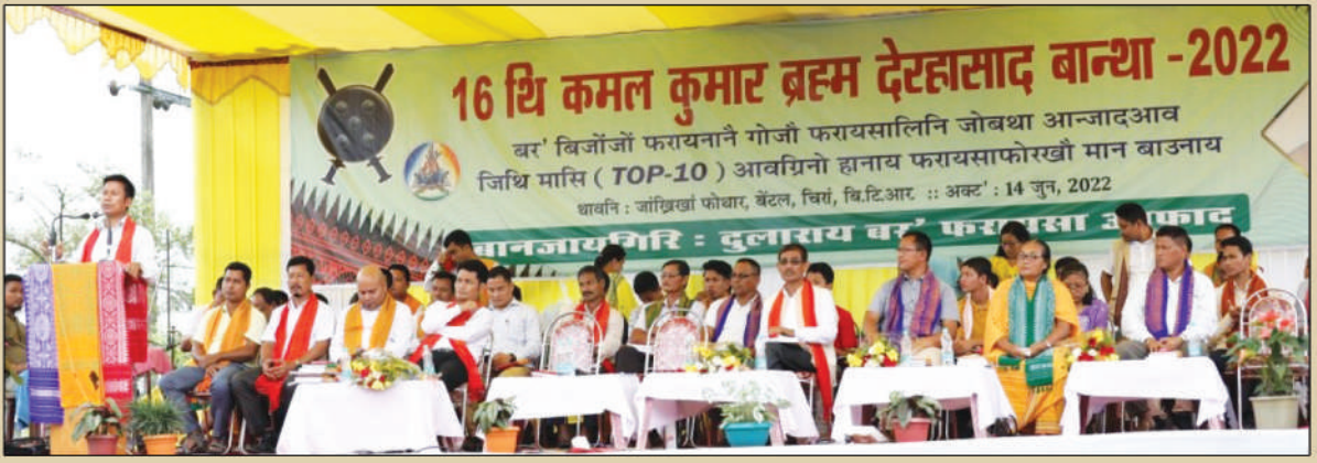
बर' बिजोंजों फरायनानै HSLC आन्जादाव जिथि मासि आवग्रिनो हानाय फरायसाफोरनो 16थि कमल कुमार ब्रह्म देरहासाद बान्था-2022 गथायनाय, थावनि: जाखिखां फोथार, बेंटल, सिरां जिल्ला, अक्ट':- 14 जुन, 2022 जुन, 2022