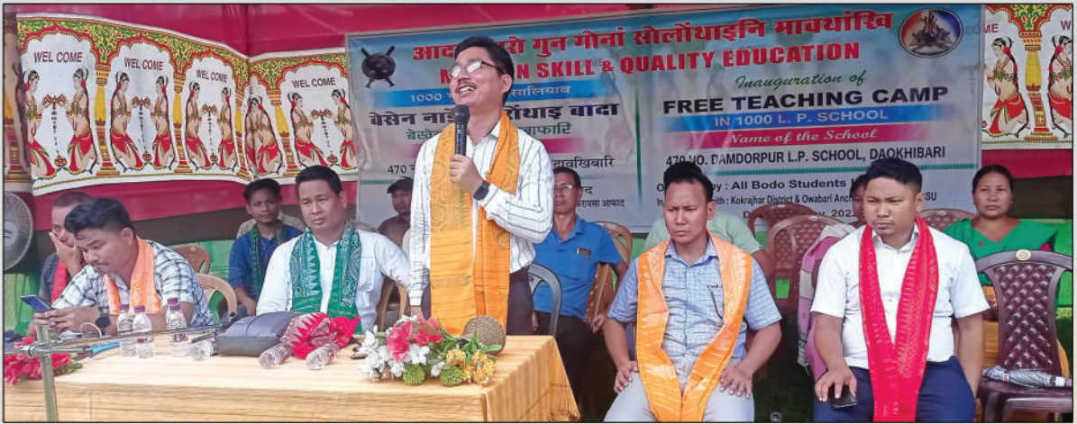
क'क्राझार जिल्ला एबसुनि बान्जायनायाव बेसेन नाडै फोरोंथाइ बादा बेखेवनाय हाबाफारियाव बाहागो लाहैनाय थावनि : 470 दामदरपुर गुदि फरायसालि, दावखिबारि, क'क्राझार, अक्ट' : 31 मे, 2022