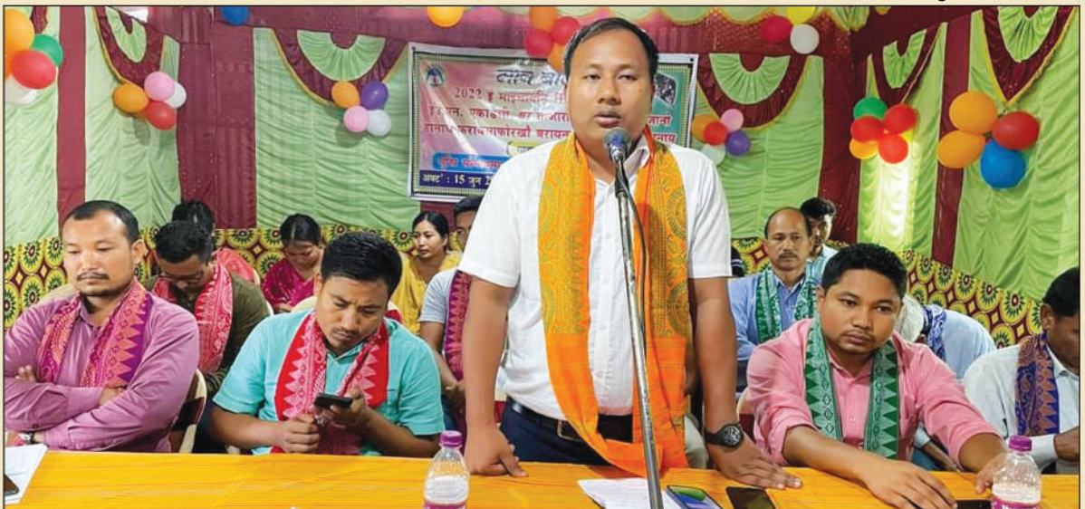
बरायनाय हाबाफारियाव बाहागो लाहैनाय थावनि: इ.एन. एकाडेमी, बर'बाजार, बिजनी, अक्ट': 14 जुन, 2022