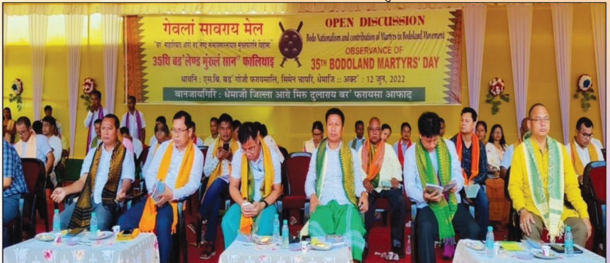
35थि बड'लेण्ड मुंख्लं सान फालिथाइनि गोवलां सावराय मेल थावनि:- एस.बि. बड' गोजी फरायसालि गेलेग्रा फोथार, चिमेन चाप'रि, धेमाजि, अक्ट':- 12 जुन, 2022