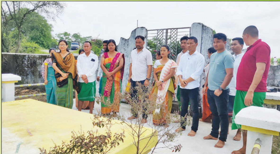
बड'लेण्ड सोमावसारनायनि बर'नि गिबि आइजो गायदे आरो हेलेना बसुमतारिनि मुंखलं सान फालिनायाव बाहागो लाहैनाय थावनि: गायदे आरो हेलेना बसुमतारिनि मांखरसालि, सराइबिल, ग'साइगाव, अक्ट': 12 मे, 2022