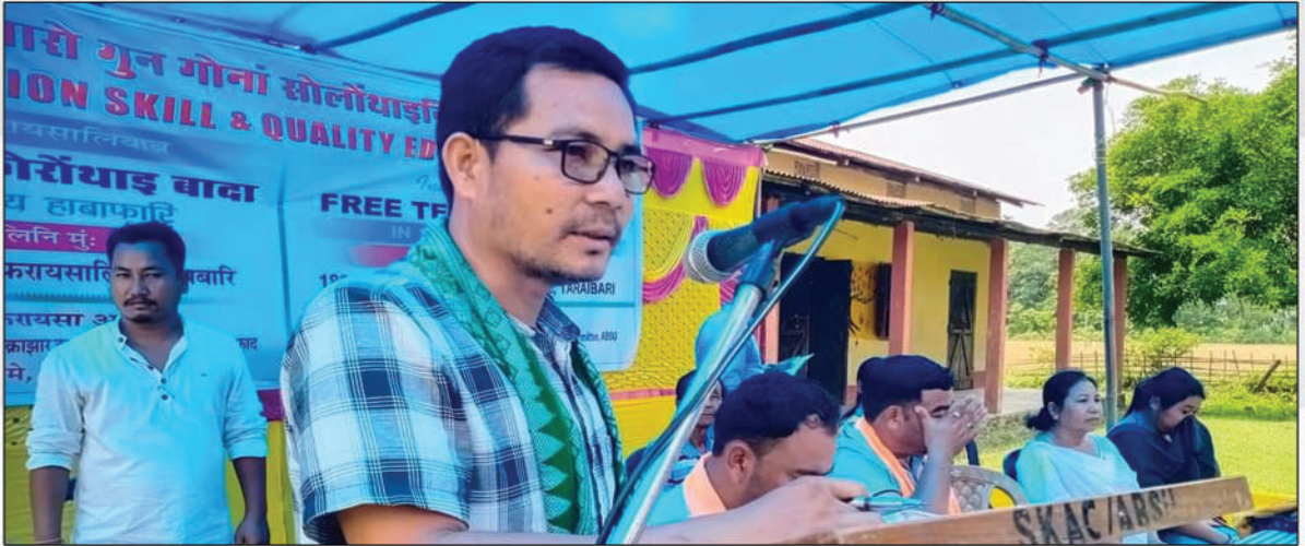
क'क्राझार जिल्ला एबसुनि बान्जायनायाव बेसेन नाडै फोरोंथाइ बादा बेखेवनाय हाबाफारियाव बाहागो लाहैनाय थावनि : 189 नं थाराइबारि गुदि फरायसालि, क'क्राझार, अक्ट' : 31 मे, 2022