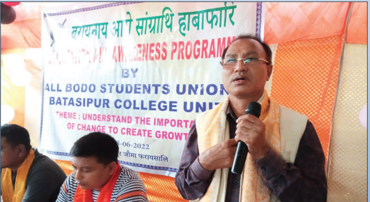
बरायनाय आरो सांग्रांथि हाबाफारियाव बाहागो लानाय थावनि: बातासिपुर क'लेज, शनितपुर अक्ट': 18 जुन, 2022