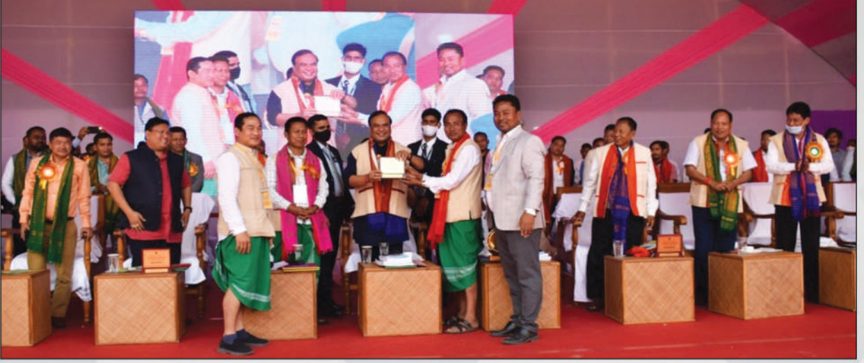
दुलाराय बर' फरायसा आफादनि 54 थि थान्दै जख'न्थाइनि गेवलां मेल थावनि:- हाजोआरि फोथार, लांहिन, कार्बि आंलं जिल्ला, अक्ट' : 3, 4 & 5 मार्च, 2022