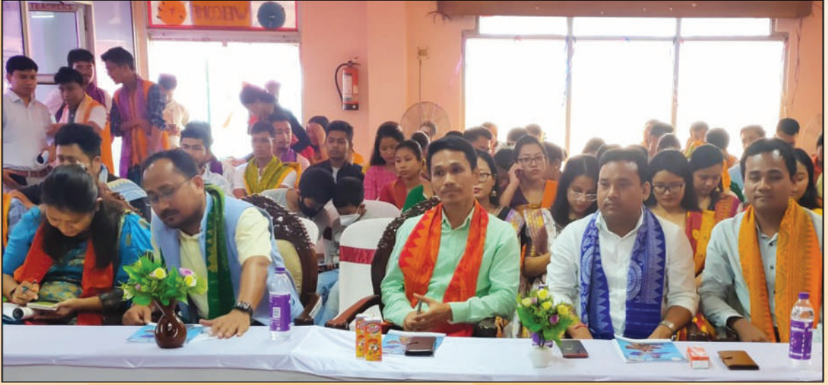
गौहाटी मेडिकल क'लेजनि गोदान बर' फरायसा बराय फोर्बो आरो फरायसाफोरनि लोगो हमलायनाय हाबाफारियाव बाहागो लाहैनाय, थावनि: GMCH STAFF CANTEEN, 1st Floor, अक्ट':- 12 जुन, 2022