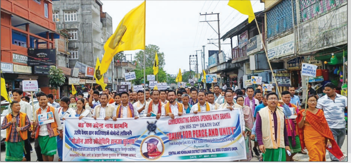
1 मे, 2022 बड'फा उपेन्द्र नाथ ब्रह्मनि 32थि थैनाय सान फालिनायजों लोब्बा लाखिनानै क'क्राझार गोजौसिन आरो थांखि गोबां फरायसालिफ्राय बड'फा सिलड्रेन पार्कसिम गोजोन आरो खौसेथिनि थाखाय हान्जा सुरनाय।