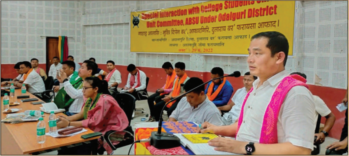
अदालगुरि जिल्ला सिनि गुबुन-गबुन फरायसालिमानि फरायसाफोरजों जर'खा सावराय मेलाव बाहागो लानाय थावनि : अदालगुरि फरायसालिमानि नब्लां, अक्ट' : 29 मे, 2022