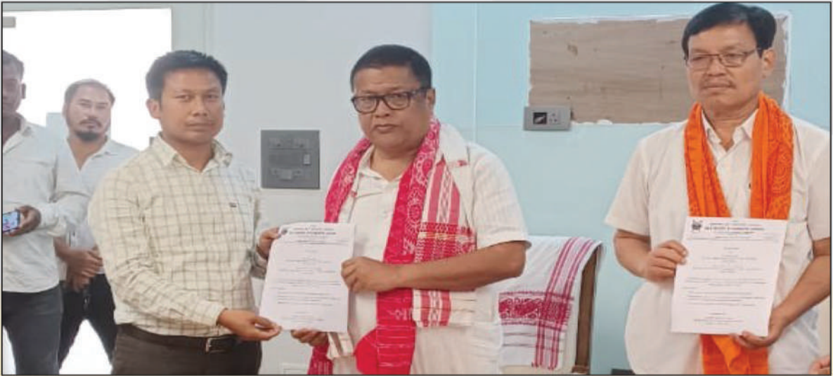
गुवाहाटीनि बरबारियाव इभिकसन खालामनायजानाय नख'रफोरनि जेंना सुसानायनि थाखिजों आसाम सरकारजों सावरायनाय थाविन:- दिसपुर, गुवाहाटी, अक्ट':- 24 मे, 2022