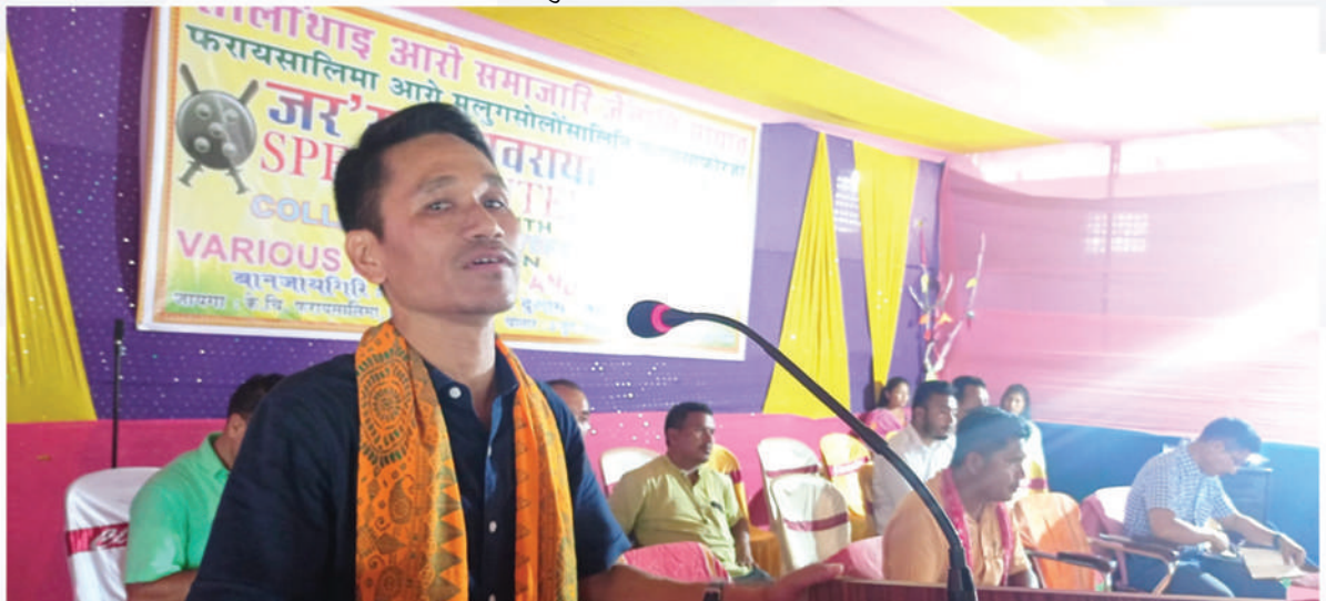
बागसा जिल्ला सिंनि गुबुन-गबुन फरायसालिमानि फरायसाफोरजों जर्'खा सावराय मेलाव बाहागो लानाय थावनि : के. चि. फरायसालिमानि नब्लां, बागसा, अक्ट' : 3 जुन, 2022