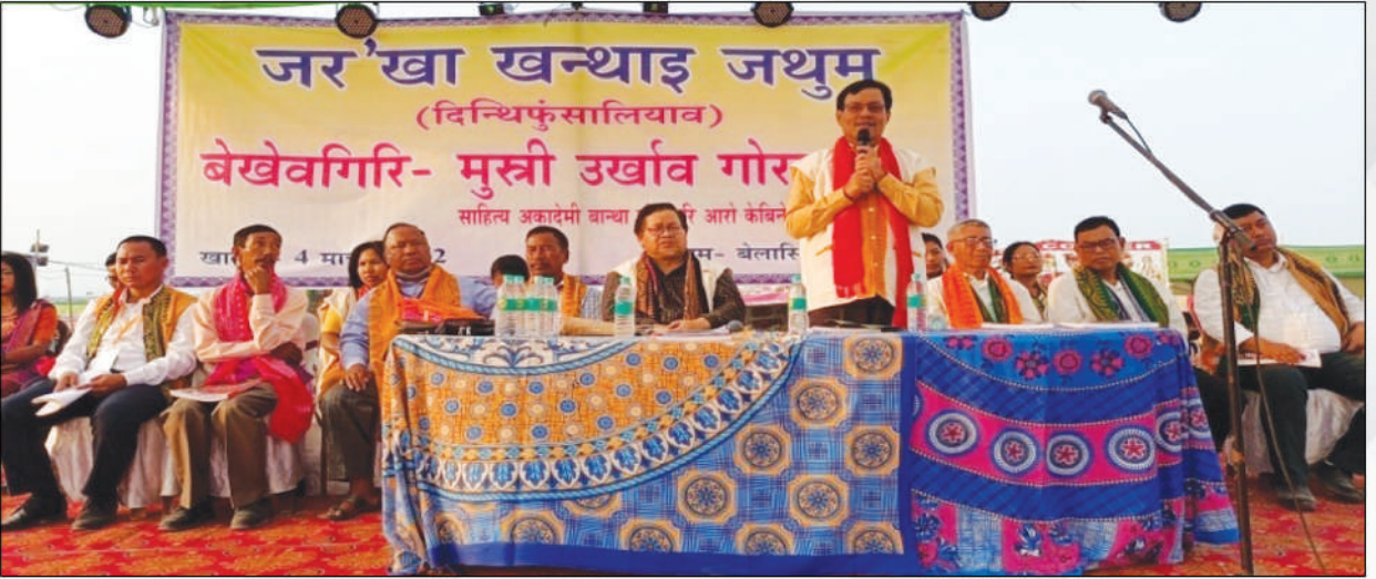
एबसुनि 54 थि थान्दै जखन्थाइजों लोब्बा लिखनानै जर'खा खन्थाइ जथुम खुंफुनाय थावनि : हाजोआरि फोथार, लांहिन, कार्बि आंलं, अक्ट': 4 मार्च, 2022