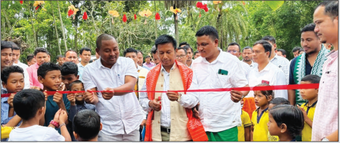
18 मे बर' बिजों सान फालिनाय लोगोसे बेसेन नाडै फोरोंथाइ बादा बेखेवनाय हाबाफारि थाविन : 4 नं बटाबारि गुदि फरायसालि, अदालगुरि, अक्ट' : 18 मे, 2022