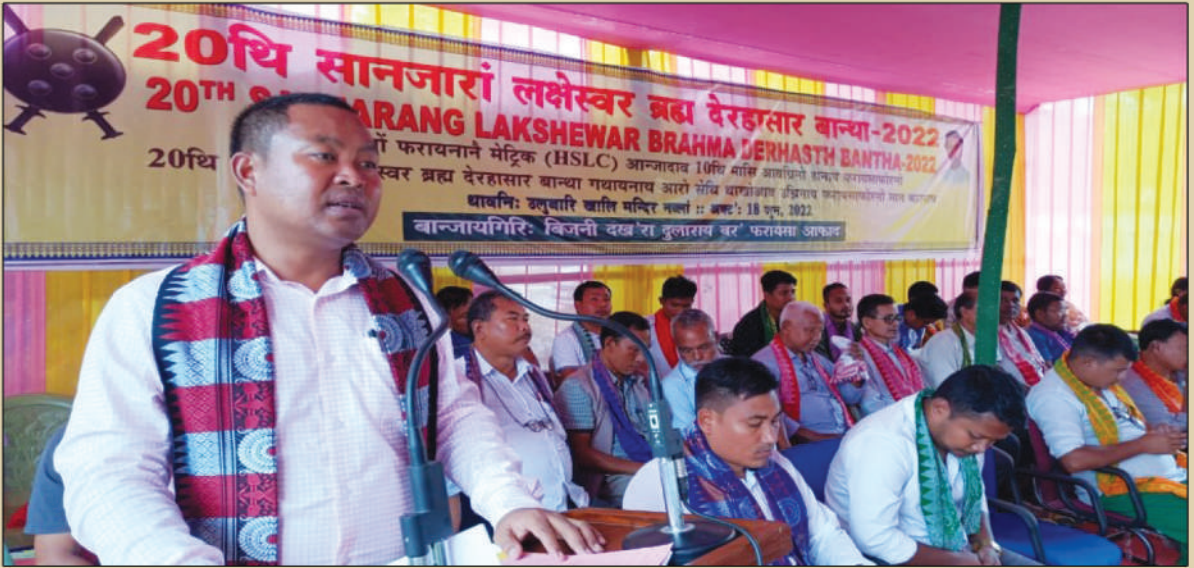
HSLC आनजादाव जिथि (10) मासि आवग्रिनो हानाय फरायसाफोरनो 20थि सानजारां लक्षेस्वर ब्रह्म बान्था-2022, गथायनाय हाबाफारियाव बाहागो लाहैनाय, थावनि:- उलुबारि खालि मन्दिर नल्तां, अक्ट':- 18 जुन, 2022