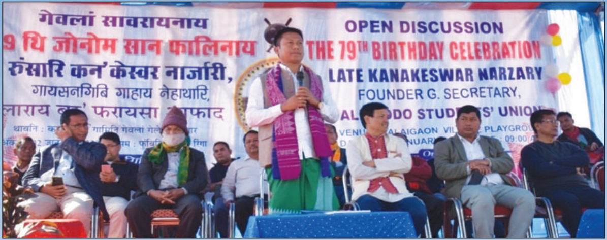
रुंसारि कन'केस्वर नार्जारीनि 79 थि जोनोम सान फालिनाय थावनि: कालाइगाव गामिनि गेवलां गेलेग्रा फोथार, रामफलबिल, क'क्राइर, अक्ट': 2 जानुवारी, 2022