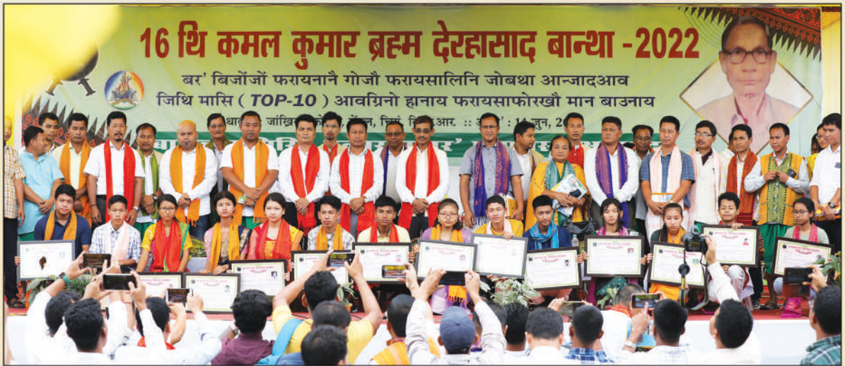
बर' बिजोंजों फरायनानै HSLC आन्जादाव जिथि मासि आवग्रिनो हानाय फरायसाफोरनो 16थि कमल कुमार ब्रह्म देरहासाद बान्था-2022 गथायनाय थावनि: जांखिखां फोथार, बेटल, सिरां जिल्ला, अक्ट':- 14 जुन, 2022