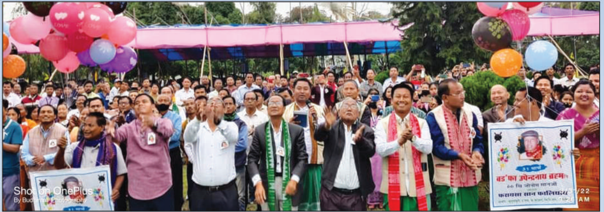
बड'फा उपेन्द्र नाथ ब्रह्मनि 66 थि जोनोम सान फालिनाय थावनि: थुलुंगाफुरि, दत'मा, क'क्राइर, अक्ट': 31 मार्च, 2022