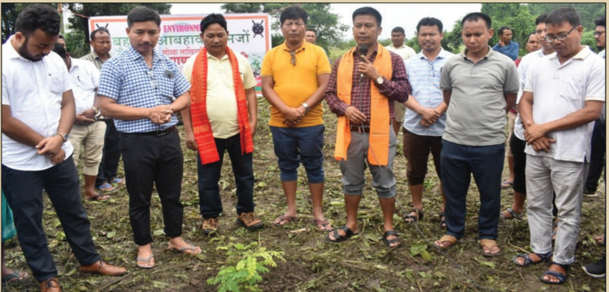
मुलगनां आबहावा सान फालिनाय, थावनि : सालबारि, जिथि दख'रा, सिरां, अक्ट': 5 जुन, 2022