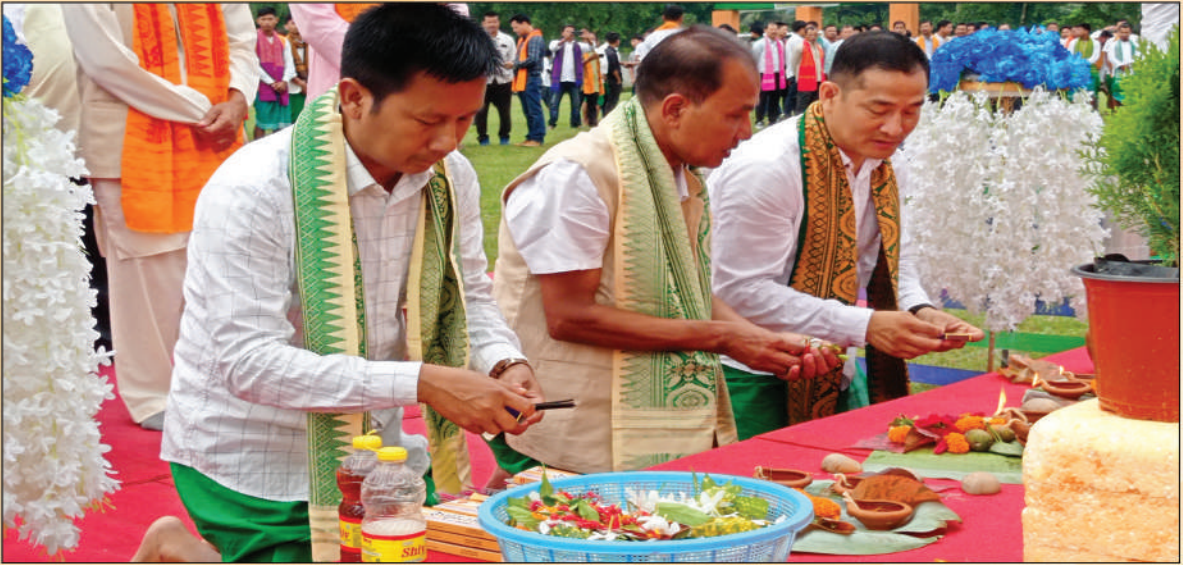
बड'लेण्ड मुंखलंफोरनो बिबार बाउनाय थावनि : एस.बि. बड' गोजौ फरायसालिनि गेलेग्रा फोथार, धेमाजि, अक्ट' : 12 जुन, 2022