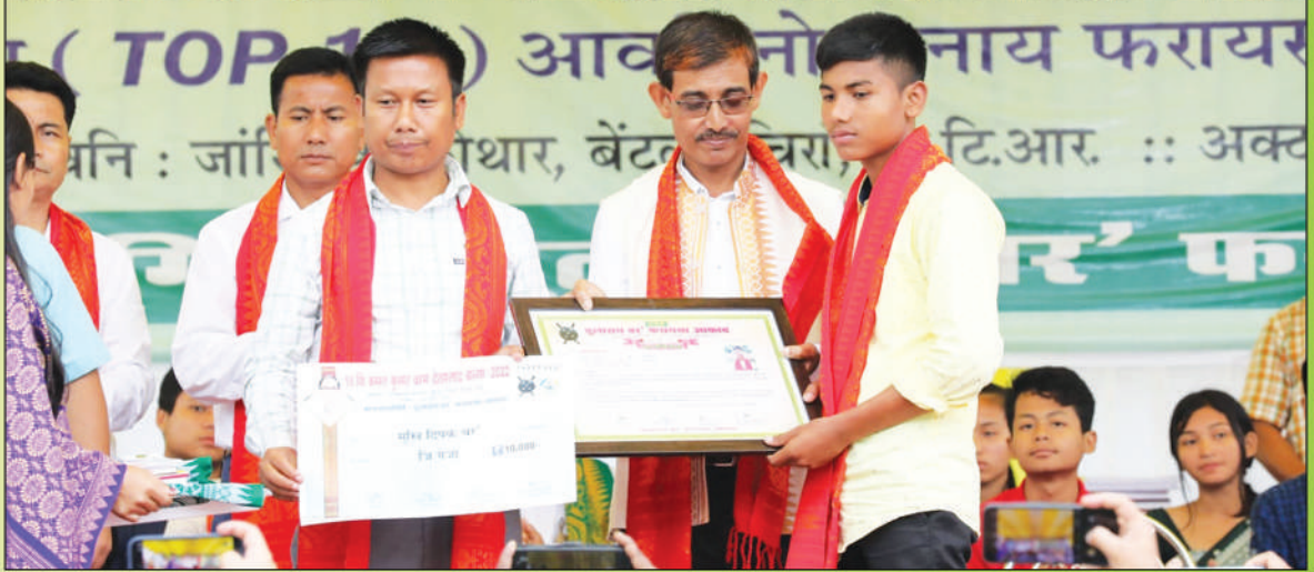
थावनि: जांख्रिखां फोथार, बेंटल, सिरां जिल्ला, अक्ट':- 14 जून, 2022 जून, 2022