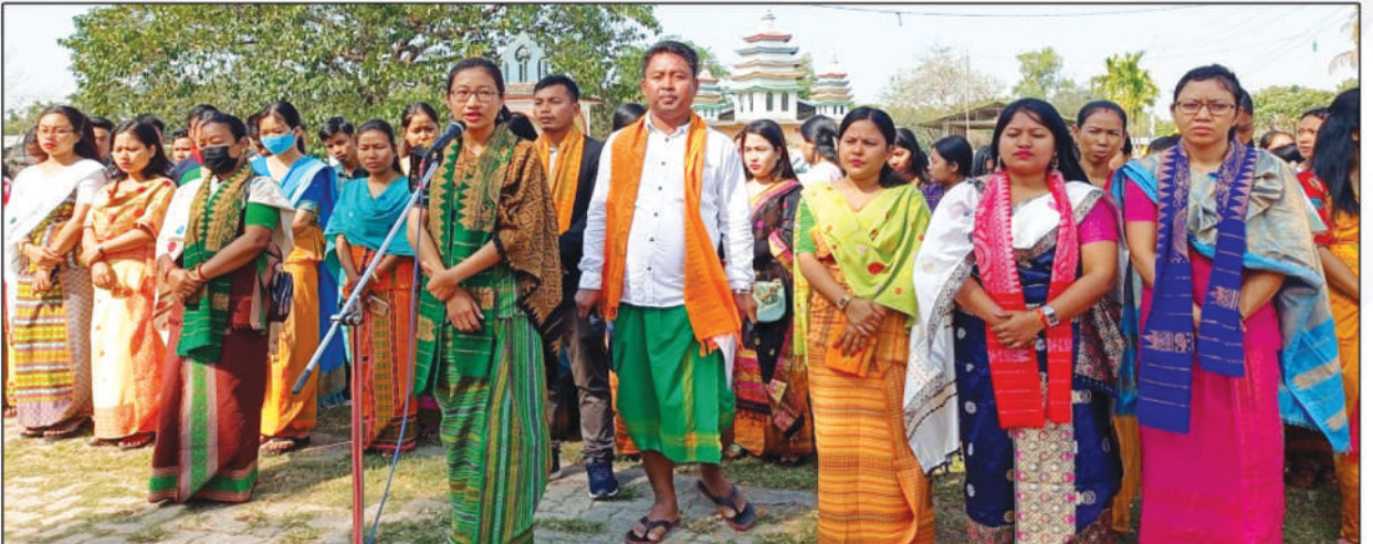
मुलुगनां आइजो सान फालिनाय थावनि:- राजा इरागदाव नब्लां, तितागुरि, क'क्राझार, अक्ट': 8 मार्च, 2022